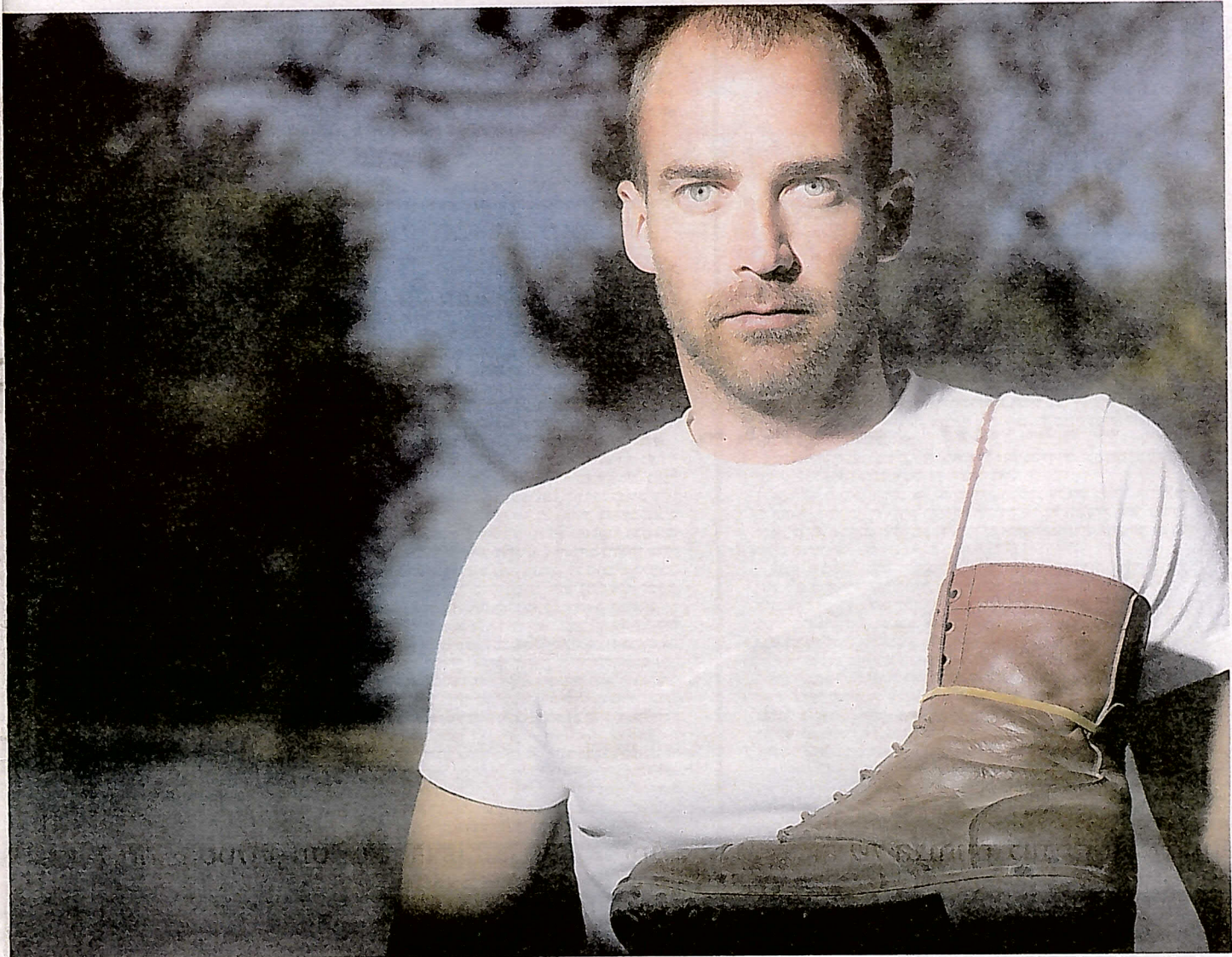
אסטליין. "אתם אולי עוד לא מבינים את זה, אבל הייתם חלק ממהלך היסטורי", אומר לנו המגיד